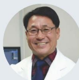
Goo Taeg Oh Ewha Womans University

Targeting myeloid cells for stroke immune therapy